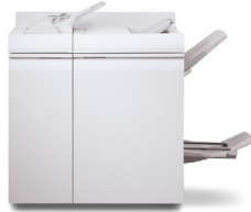
Solution de finition multifonction Pro Plus