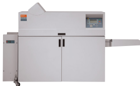
Création de fascicules C.P. Bourg BDFNx