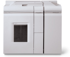
Module de finition agrafage à connexion directe