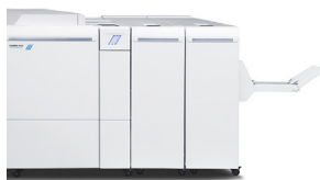
Plieuse/brocheuse Plockmatic Pro 50/35 (Disponible sur le 120/144/157 uniquement)