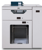
Module d'alimentation à double mode C.P. Bourg BSFx