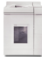
Module de finition agrafage