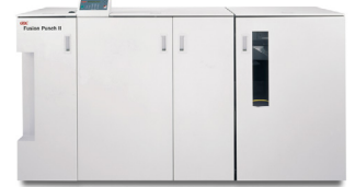
Perforatrice GBC® FusionPunch® II avec bac à décalage