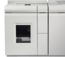
Module de finition agrafage Plus (BFM Plus)