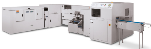
Xerox® Book Factory