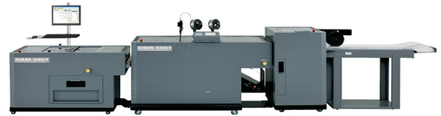
Plieuse/brocheuse Duplo DBM-5001