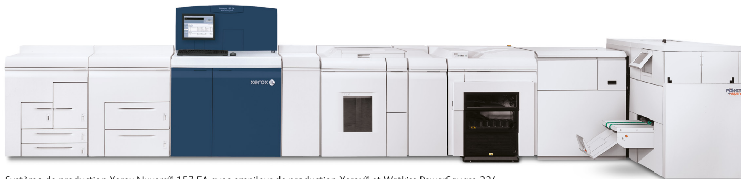
Système de production Xerox Nuvera® 157 EA avec empileur de production Xerox® et Watkiss PowerSquare 224