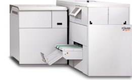
Plieuse/brocheuse Watkiss/PowerSquare™ 224