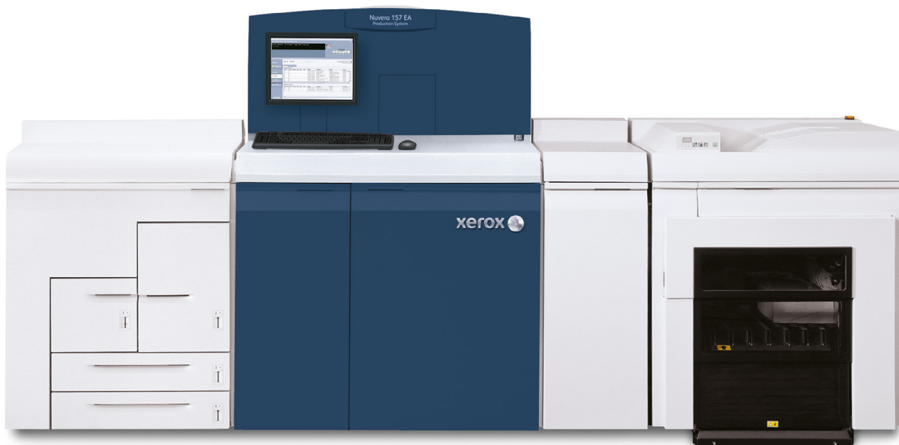
Système de production Xerox Nuvera® 157 EA avec empileur de production Xerox®